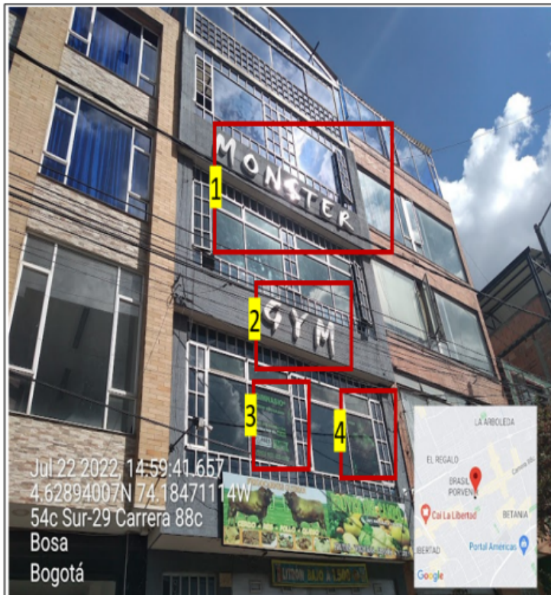
En la que se puede evidenciar: dos (2) elementos publicitarios instalados en antepechos superiores al segundo piso, identificados con los números 1 y 2. De igual forma se observa dos (2) elementos publicitarios incorporados en las ventanas haciendo alusión a su actividad económica identificados con los números 3 y 4.